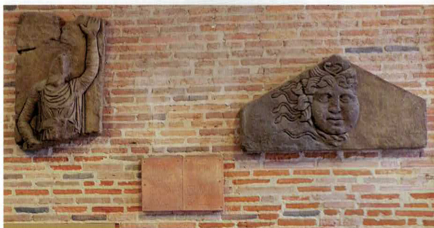
Rzymskie płaskorzeźby eksponowane przy głównym wejściu do Instytutu