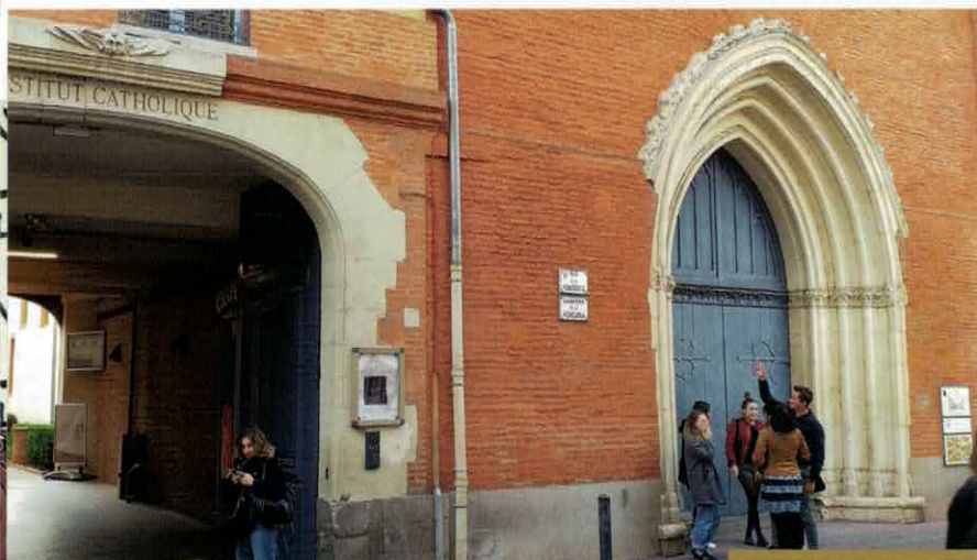
Główna brama i portal kaplicy św. Klary